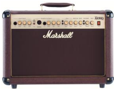
MARSHALL AS 50D Precio: 349 € Oferta: 295 €

Marshall se enorgullece de presentar la AS50D. Basado en el galardonado AS50R, este magnífico amplificador con un nuevo tweeter, incluye alimentación phantom para micrófono, Chorus digital y Reverb. Cuenta con dos canales independientes. Una entrada Dual piezo/micro/línea y otra dedicada a piezo. Dispone de un lazo de efectos paralelo. Equipado con un excelente control de retroalimentación con control de fase. Etapa de potencia de 50 vatios libres de distorsión.