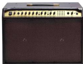
TANGLEWOOD AC-60 Precio: 420 € Oferta: 357 €

Incorpora Chorus y Reverb. También a bordo una entrada de línea para conectarse a MP3/CD y una salida de extensión para conectar un equipo de exteriores.