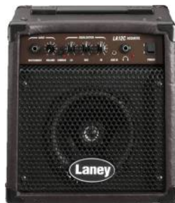
LANEY LA 12C Precio: 105 €

El LA20C es brillante, con buen detallado de reproducción acústica, que es manejado con facilidad por su bajo peso. El tweeter Co-axial añade matices no oídos anteriormente en amplificadores de este precio.