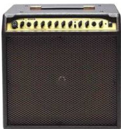
TANGLEWOOD AC-30 Precio: 320 € Oferta: 272 €

El AH Markacoustic 250 es un cabezal compacto y ligero para instrumentos acústicos. Conéctalo a tu pantalla preferida o utilízalo como un preamplificador sin altavoz para ir directamente a línea de tu equipo de sonido y voces ajustando el volumen maestro a cero. El amplificador analógico es de 150W @ 8 ohmios o 250W @ 4 ohmios, y ofrece dos canales de preamplificador (un 1 / 4 "y una XLR/1/4" toma combinada con alimentación phantom 48V). Incluye filtro anti-feedback controles de fase inversa regulable 0°, 180°, para capturar la verdadera esencia del sonido acústico sin problemas de acoplamiento indeseables.