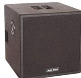
MARK ACOUSTIC CA 101 Precio: 559 € Oferta: 499 €

Entrada de micrófono XLR / JACK con control de volumen separado y se obtiene un paquete excepcional para el uso en o fuera del escenario.