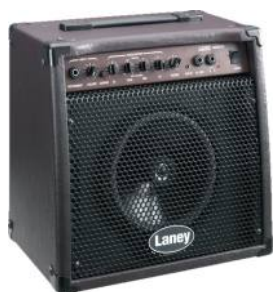
LANEY LA 20C Precio: 159 €

Impedancia 8 ohms Respuesta de frecuencias 55 Hz a 18 Khz. Altavoz de 1x10" de neodimio Sistema de sonido Reflex Tweeter de compresión de agudos de 1" 200W RMS de potencia