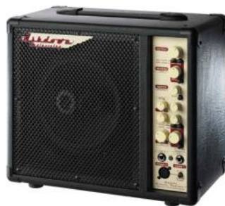
ASHDOWN Acoustic Radiator AAR1VR Precio: 485 € Oferta: 412 €

Marshall se enorgullece de presentar la AS50D. Basado en el galardonado AS50R, este magnífico amplificador con un nuevo tweeter, incluye alimentación phantom para micrófono, Chorus digital y Reverb. Cuenta con dos canales independientes. Una entrada Dual piezo/micro/línea y otra dedicada a piezo. Dispone de un lazo de efectos paralelo. Equipado con un excelente control de retroalimentación con control de fase. Etapa de potencia de 50 vatios libres de distorsión.