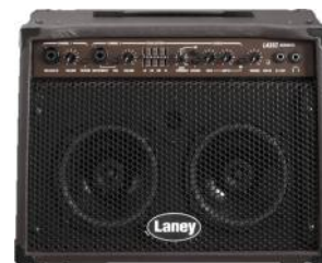
LANEY LA 35C Precio: 245 € Oferta: 219 €

Al conectarse al LA12C obtiene un sonido sorprendentemente fuerte y completa, dada la pequeña potencia del amplificador. Rico en frecuencias graves, pero sin comprometer la respuesta de frecuencias de la guitarra. El Chorus incorporado añade dimensión al sonido cuando se desea este efecto. Ideal para componer y grabar en casa.