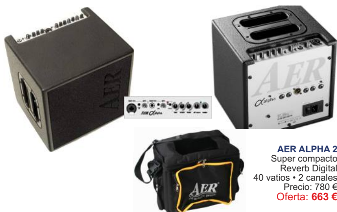
AER ALPHA 2 Super compacto Reverb Digital 40 vatios • 2 canales Precio: 780 € Oferta: 663 €

Cualquier instrumento del que deseemos reproducir fielmente su sonido natural, debe ser reproducido únicamente con este tipo de amplificadores. Están fabricados especialmente para obtener un sonido de respuesta plana, sin estridencias. Donde la reproducción a altos niveles de volumen no debe significar pérdidas de las características originales del instrumento. Esta es la filosofía que ha proyectado a los fabricantes con éxito respecto a sus competidores.