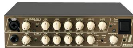
MARK ACOUSTIC AH 250 Precio: 719 € Oferta: 647 €

Esta Serie ofrece este modelo que a pesar de ser económico es uno de los mejores amplificadores acústicos del momento. Imprescindible probarlo y compararlo.